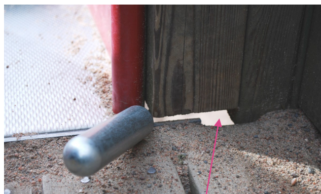
Utrymme där fingrar kan fastna.