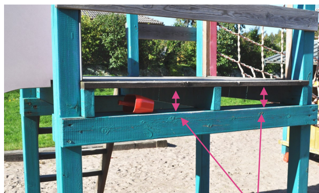
Utrymmen där huvud och hals kan fastna.