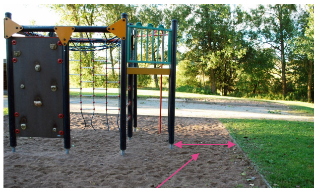
Fallutrymme för snävt.